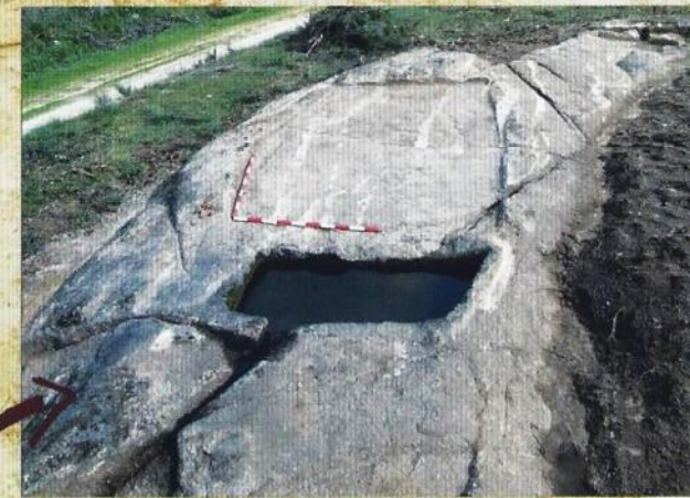
Lagar de Cabreira / Pozo do Demo Concello de Verín

Parroquia de Cabreira. Coordenadas: X: 63902; Y: 4612593