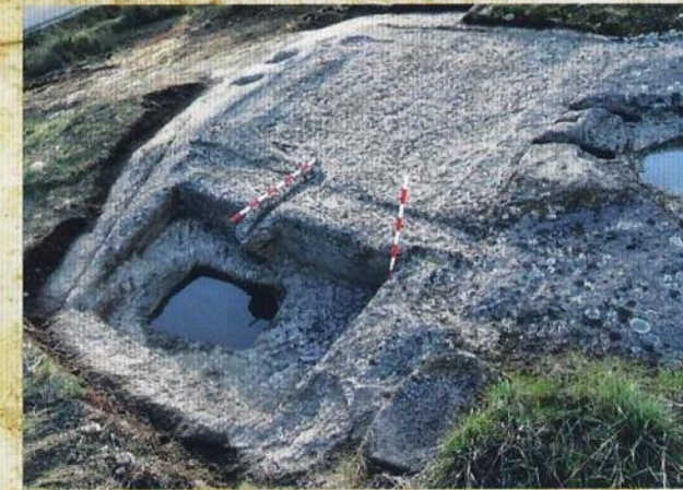
Lagar da Chaira Concello de Monterrei

Parroquia de Ábedes. Coordenadas: X: 631263; Y: 4643660