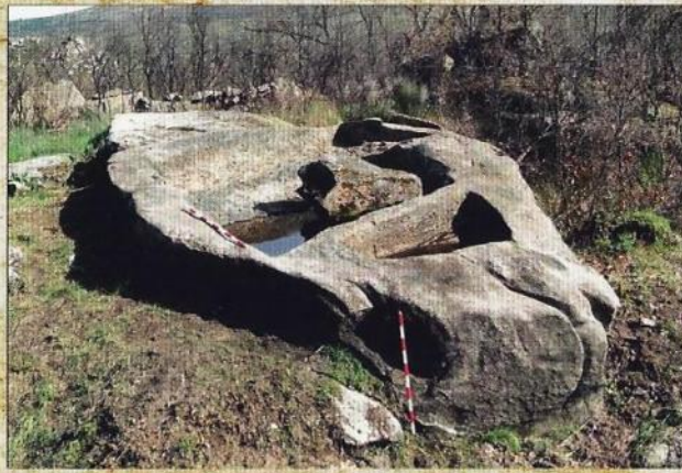
Lagar do Trugán Concello de Cualedro

Parroquia de San Millao. Coordenadas: X: 67137; Y: 4638699