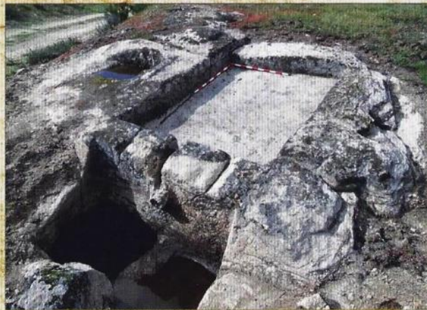
Lagar da Ribeira de Fornos Concello de Ombra

Entre la Edad Media y la Edad Moderna solo había lagares de viga en las residencias de los poderosos (monasterios, castillos y granjas de señores); los agricultores humildes vitificaban entre las viñas, en los lagares rupestres